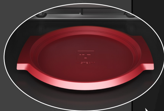
Zásobník na vodu