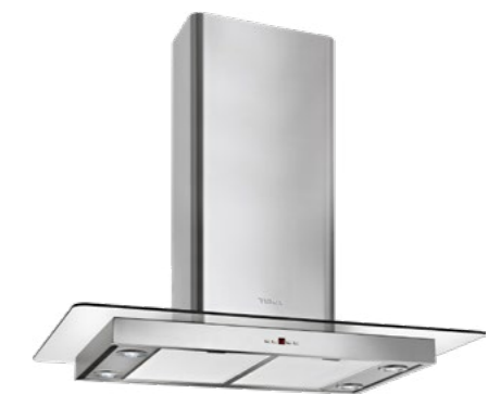
TOTAL DG3 ISLA Código: 091401 UPC: 606896914010

MEDIDAS EXTERIORES Alto 740-1.120mm Ancho 914mm Profundo 640mm