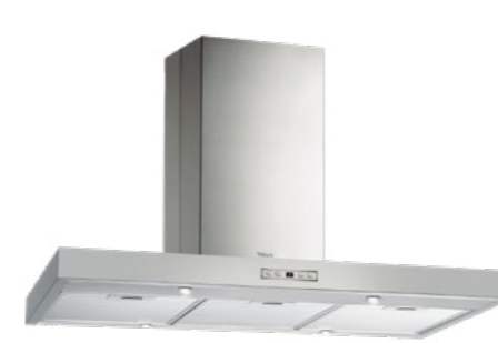
MAESTRO DH2 ISLA 980 Código: 40484631 EAN: 8421152145722