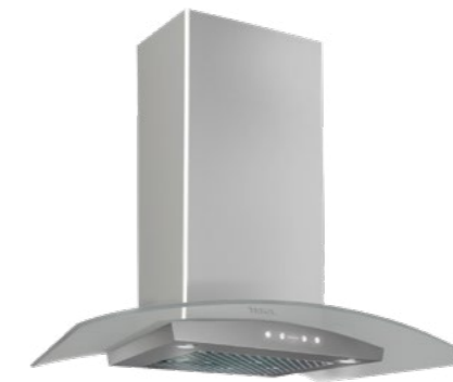
MAESTRO NC 970 CT ISLA Código: 40489601 EAN: 8421152141427

MEDIDAS EXTERIORES Alto 600-1.000mm Ancho 900mm Profundo 600mm