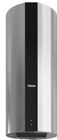
MAESTRO CC 480 Código: 40480321 EAN: 8421152145876