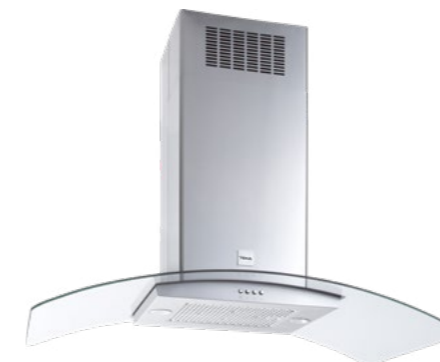
EASY NC 1040 ISLA Código: 40494002 EAN: 8421152144978

MEDIDAS EXTERIORES Alto 871-1.171mm Ancho 900mm Profundo 600mm